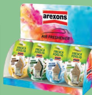
Expo da banco Counter display

Contenuto / Content 15721 Vanilla (2 pcs) 15791 Pour Homme (2 pcs) 16621 Vetiver (2 pcs) 16631 Cool Water (2 pcs) 19091 Pinewood (2 pcs) 19551 Pour Femme (1 pcs) 19561 Orange Candy (1 pcs)