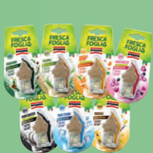
Cartone misto Mix-box

UNA COMUNICAZIONE IMPATTANTE PER IL punto vendita EFFECTIVE COMMUNICATION FOR POINTS OF SALES