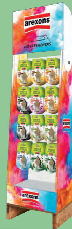
Expo da terra Floor display

Contenuto / Content 15721 Vanilla (2 pcs) 15791 Pour Homme (2 pcs) 16621 Vetiver (2 pcs) 16631 Cool Water (2 pcs) 19091 Pinewood (2 pcs) 19551 Pour Femme (1 pcs) 19561 Orange Candy (1 pcs)